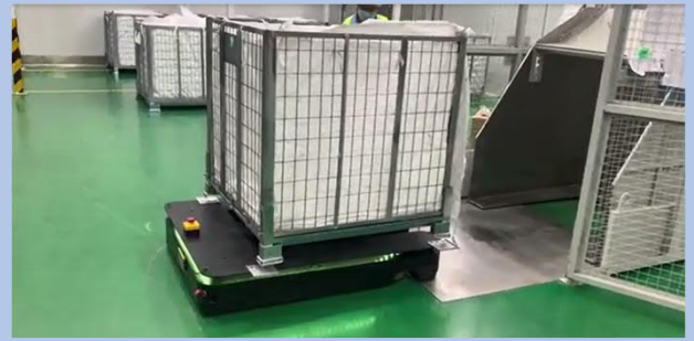
車体上部に積載して搬送